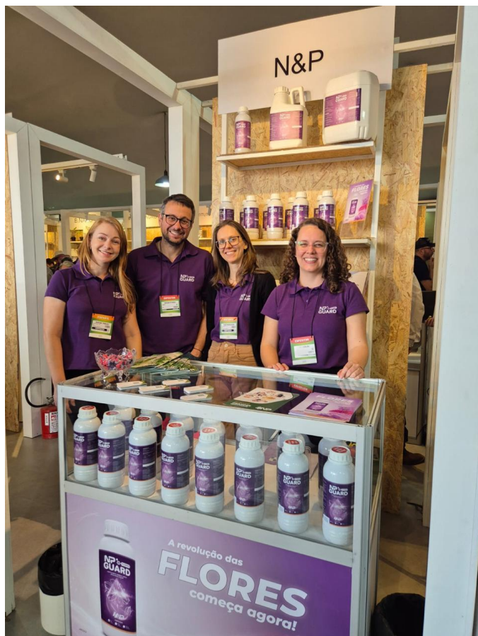
Equipe N&P na 29ª HORTITEC

A N&P é uma startup de base científica e tecnológica, localizada em Araraquara/SP, que desenvolve soluções inovadoras para produtores rurais e profissionais do mercado agrícola.