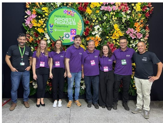
Feira de oportunidades da Cooperflora 2024

Para o desenvolvimento de novos produtos, a empresa conta com o apoio de agências de fomento como a FAPESP, o CNPq e um programa da Prefeitura Municipal de Araraquara.